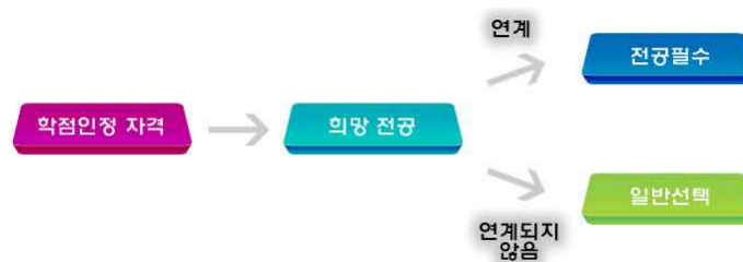
[그림 4] 자격 학습구분 결정 기준