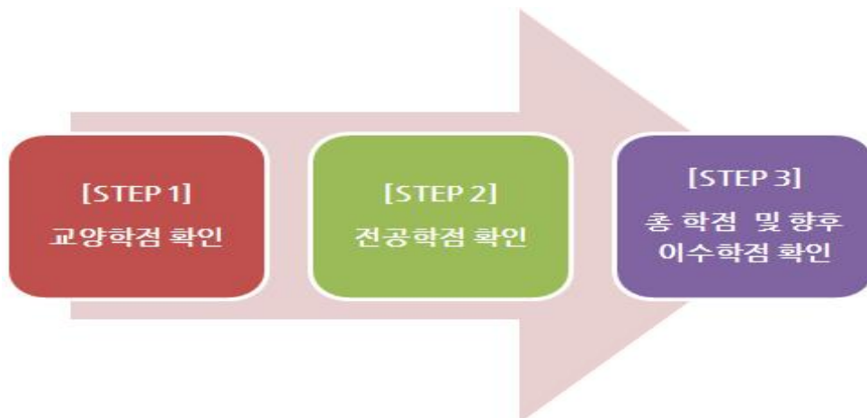
[그림 4] 학점은행제 학습설계 순서도