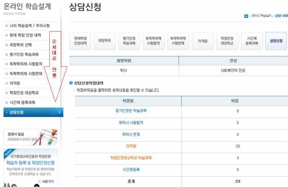
[그림 13] 온라인 학습설계 시스템