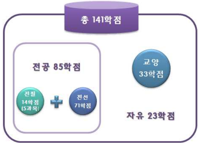
[그림 9] '예시 1'의 총학점 구성도

✓ 교양 과목 : 전공별 이수 교양 과목이 정해져 있지는 않으므로 학점은행제 [표준교육과정]-[교양] 과목을 평가인정 학습과목 혹은 시간제등록으로 이수하거나, 각 대학에서 교양으로 개설한 과목을 시간제등록으로 이수할 경우 교양으로 인정받을 수 있음.