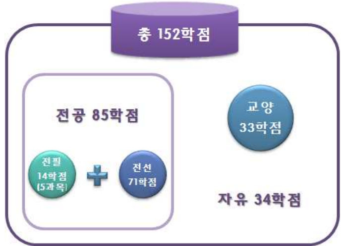
[그림 10] '예시 2'의 총학점 구성도