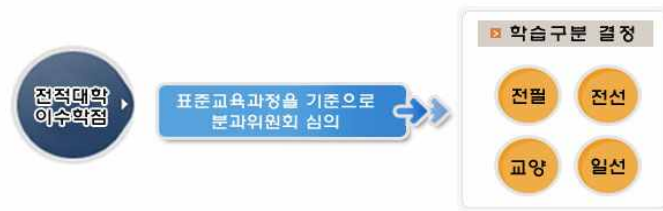
[그림 7] 학점인정대상학교 학습구분 결정 기준